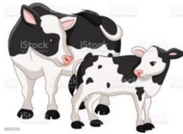
สัตว์ทุกช่วงอายุ