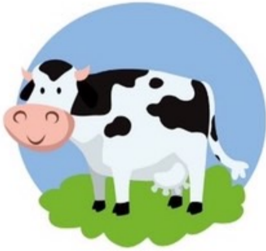
สุขภาพแข็งแรง