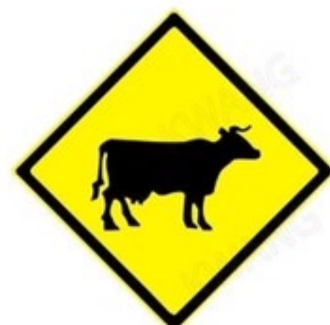
งดเคลื่อนย้ายสัตว์ หลังทำวัคซีน อย่างน้อย 30 วัน