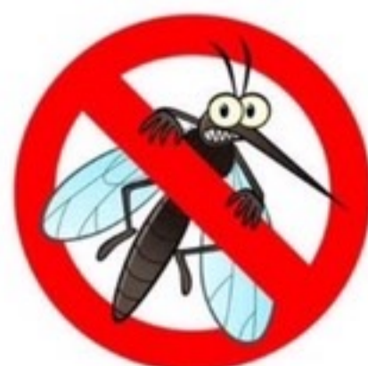
กำจัดพาหะของโรค เปิดไฟตกแมลง กางมุ้งให้สัตว์