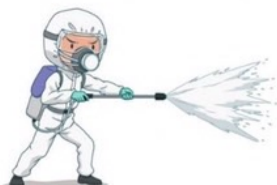
พ่นยาฆ่าแมลงบนตัวสัตว์ และพื้นคอก