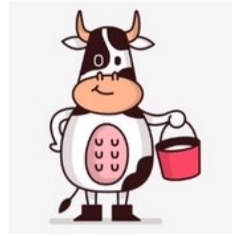
สัตว์ตั้งท้อง