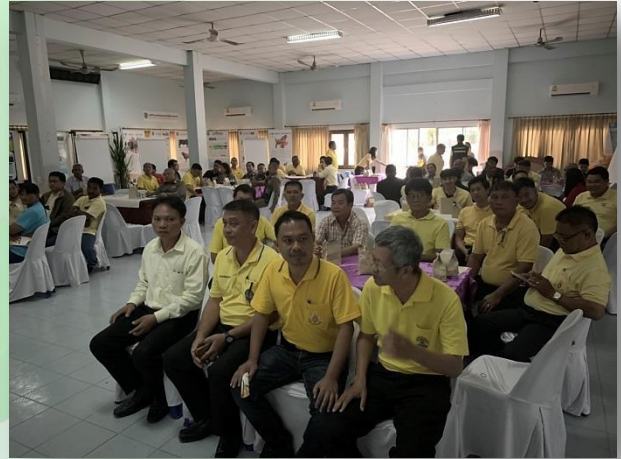
เพชรบุรี