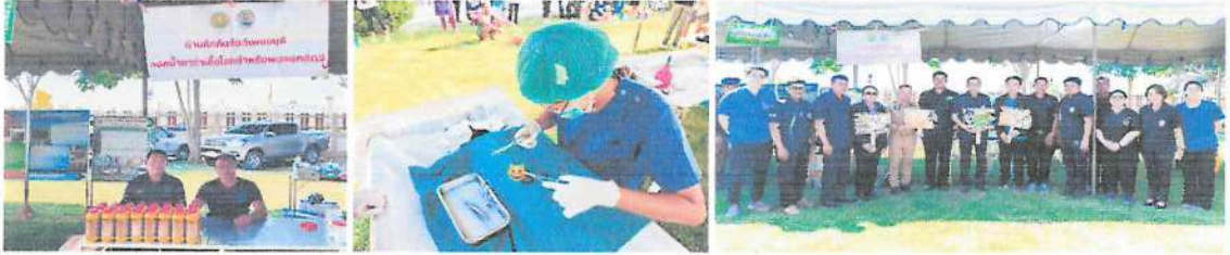
ด่านกักกันสัตว์เพชรบุรี/กลุ่มพัฒนาสุขภาพสัตว์ สบง.ปศจ.เพชรบุรี

ณ เกษบาลตำบลห้วยสะพาน อำเภอเมือง จังหวัดเพชรบุรี