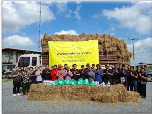
ภาพถ่ายกิจกรรมการมอบเสบียงสัตว์แห้ง สำหรับการช่วยเหลือเฉพาะหน้าผู้ประสบภัยพิบัติ กรณี ฉุกฉิน(อุทกภัย) ด้านปศุสัตว์ วันที่ ๒๑ พฤศจิกายน ๒๕๖๘ (วัดดอนตาล)