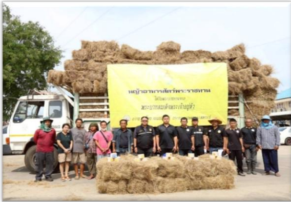
ภาพถ่ายกิจกรรมการมอบเสบียงสัตว์แห้ง สำหรับการช่วยเหลือเฉพาะหน้าผู้ประสบภัยพิบัติ กรณี อุทกภัย (อุทกภัย) ด้านปศุสัตว์ ๒๕ พฤศจิกายน ๒๕๖๘ อ.สองพี่น้อง