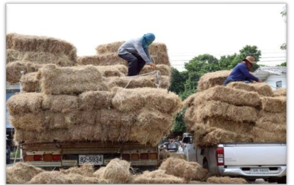
ภาพถ่ายกิจกรรมการมอบเสบียงสัตว์แห้ง สำหรับการช่วยเหลือเฉพาะหน้าผู้ประสบภัยพิบัติ กรณี อุทกภัย (อุทกภัย) ด้านปศุสัตว์ ๔ ธันวาคม ๒๕๖๘ อ.บางปลาม้า