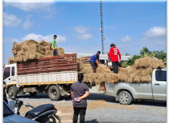
ภาพถ่ายกิจกรรมการมอบเสบียงสัตว์แห้ง สำหรับการช่วยเหลือเฉพาะหน้าผู้ประสบภัยพิบัติ กรณี ฉุกฉิน (อุทกภัย) ด้านปศุสัตว์ ๑๙ พฤศจิกายน ๒๕๖๘ อ.อุทุมพร (วัดจันทราวาส)