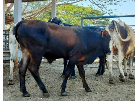
โคหมายเลข 64008PK