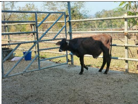
โคหมายเลข 65021PK