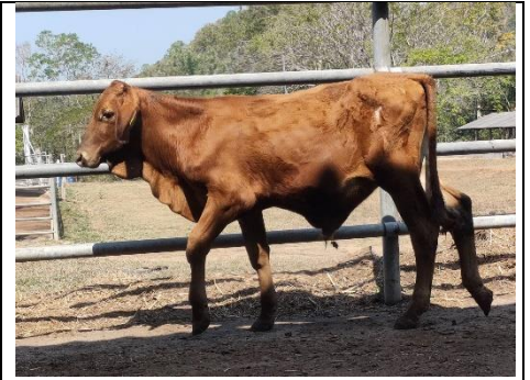
โคหมายเลข 65009PK