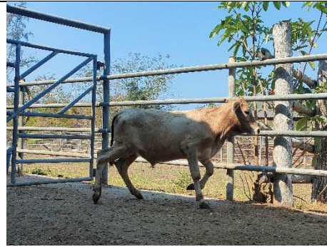
โคหมายเลข 65007PK