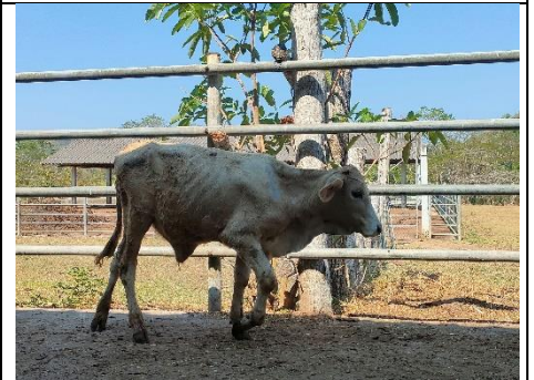
โคหมายเลข 65017PK