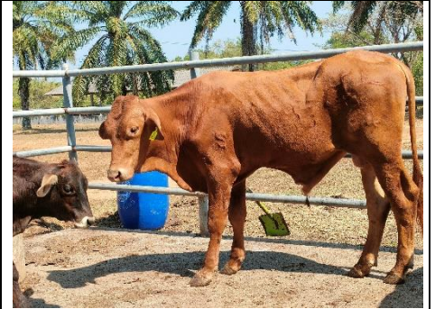
โคหมายเลข64009PK