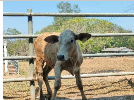
โคหมายเลข 65015PK