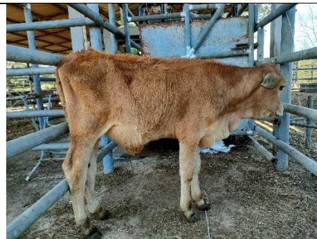
โคหมายเลข 65025PK