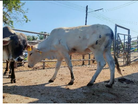
โคหมายเลข 62008PK