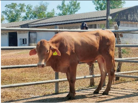
โคหมายเลข64006PK