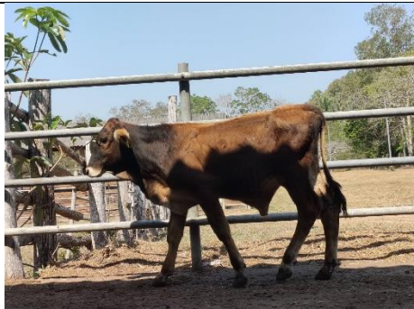
โคหมายเลข 65013PK