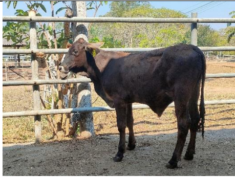
โคหมายเลข 65003PK