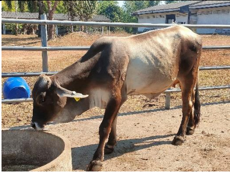
โคหมายเลข62006PK