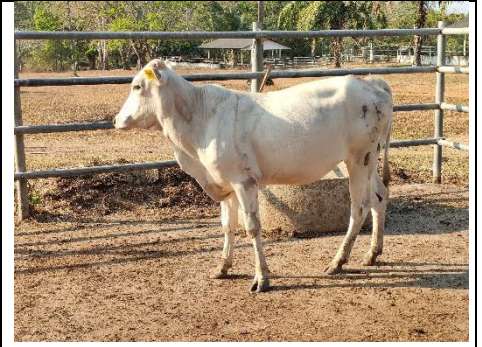
โคหมายเลข 64002PK