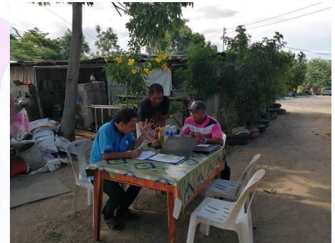
ประจวบคีรีขันธ์